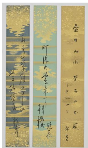
Poem-slips written by three literary giants of Kanazawa, Tokuda Shūsei (1871-1943), Izumi Kyōka (1873-1939), and Murō Saisei (1889-1962) Ishikawa Modern Literature Museum collection

本次展覽將與季節相呼應，用色紙（書寫和歌、俳句等用的方形厚紙，表面多飾以五色紋樣或金銀箔粉）、短冊（書寫和歌、俳句等用的細長詩箋）等手跡呈現作家筆下描繪春天的詩。觀眾可以透過小說家所創作的「文人俳句」以及短歌、詩作等近距離感受到作家們以其靈動的感性捕捉到的「春」。