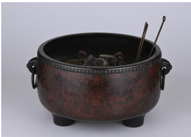
Brazier belonged by Murō Saisei (1889-1962) Ishikawa Modern Literature Museum collection

「喜歡」的力量無論是過去還是現在都十分強大。對作家而言，也會因為特別「喜歡」某樣東西而寫入作品。這一部分精心收集了作家日常使用的心愛之物、寫給初戀的書信等，展現了作家們的「喜好」。