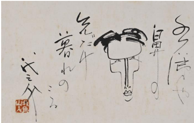
Self-portrait and legend of Akutagawa Ryūnosuke (1892-1927) Ishikawa Modern Literature Museum collection

本次展覽匯集了作家在繪畫等美術作品中的肖像，包括作家的自畫像、由朋友繪製的肖像畫，以及作家生前留給家人的面部模型等。這次將不以照片而是以青銅雕塑和繪畫等形式展現作家們的面容。