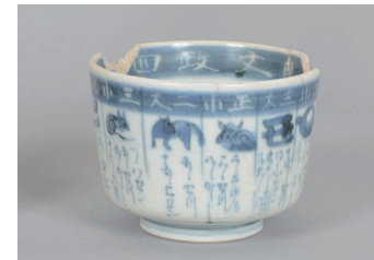
金沢市宝町遺跡出土 磨手碗(若杉窯) 江戸時代後期(19世紀) 金沢大学資料館蔵

江戸時代後期に入ると日本列島各地で数多くのやきもの窯が成立し、加賀藩や支藩の富山藩・大聖寺藩でも多くの窯が築かれます。明治維新を迎えるとそれらは廃れるものの、加賀地方ではこの時期の技術が受け継がれ、現在では日本を代表するやきもの産地として知られるようになりました。本展では美術品として伝わる資料に加え、考古資料や古文書など多様な資料から19世紀の加賀藩におけるやきもの生産に迫ります。