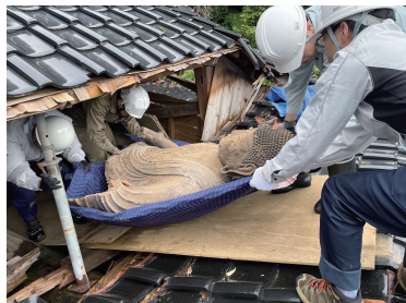
珠洲市内で行われた文化財レスキューの様子 (2024年7月)

博物館の災害時の使命として、被災した文化財の救出・継承があります。令和6年能登半島地震の発災以来、文化財レスキュー事業により、多くの文化財が救出されました。本展では、それらの被災文化財から明らかになった、能登を中心とした被災地の歴史や文化を紹介し、文化財を次代へとつないでいく第一歩とします。