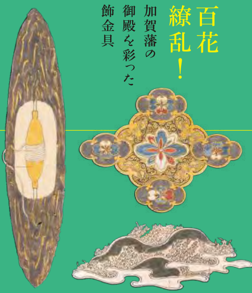
二之御丸御殿御造営内装等覚及び見本・絵形 第三冊(部分) 井上庄右衛門作 文化8年(1811) 金沢市立玉川図書館蔵(加越能文庫)