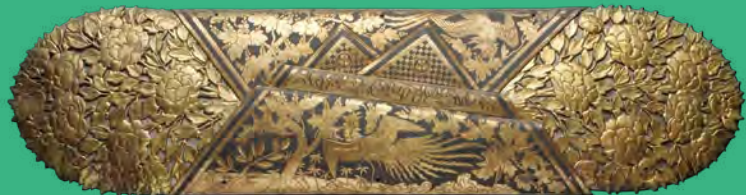
【国宝】二条城二の丸御殿大広間 花梨斗形釘隠 寛永3年(1626) 京都市(元離宮二条城事務所)蔵