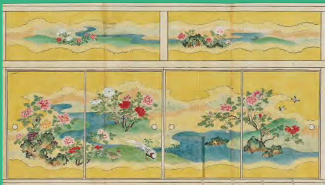
江戸城本丸等障壁画下絵 西の丸御殿大奥対面所二の間 狩野晴川院養信筆 天保9年(1838) 東京国立博物館蔵