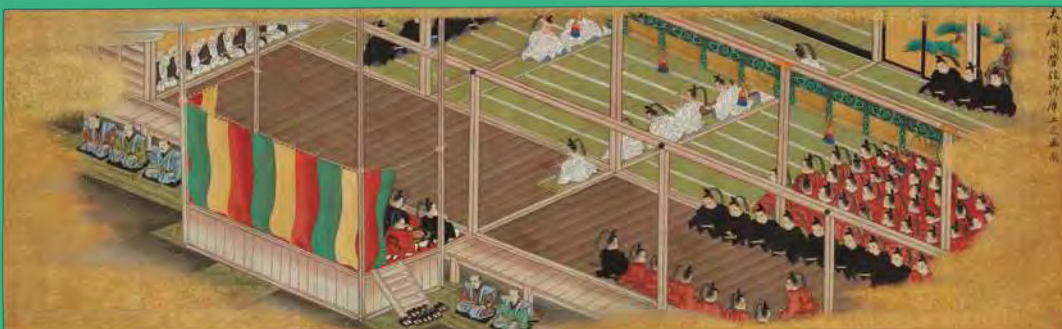
宮中管絃図 狩野墨川画・市河恭富書 文政6年(1823) (公財)前田育徳会蔵