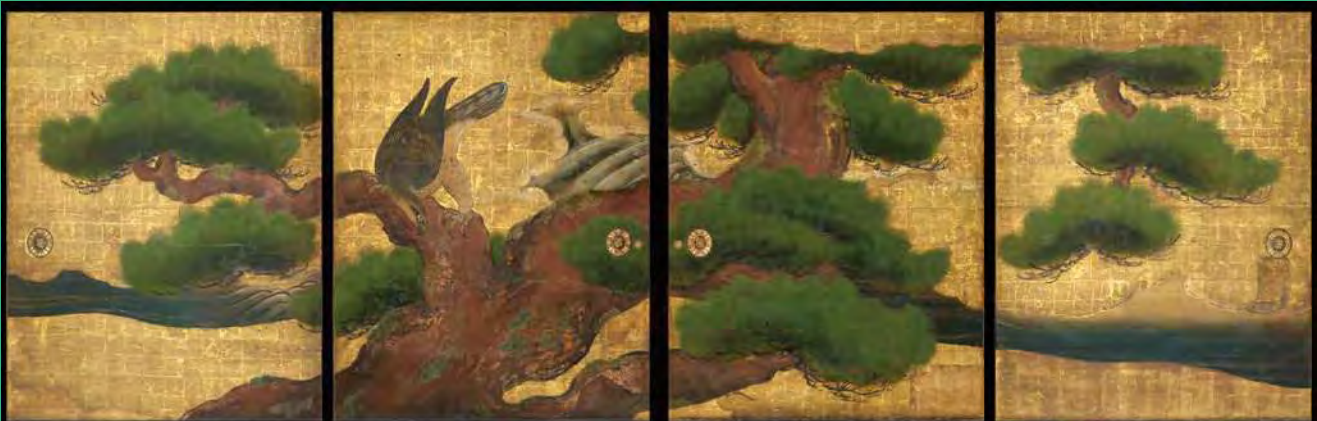
【重要文化財】二条城二の丸御殿 大広間四の間障壁画 松鷹図 狩野山楽筆 寛永3年(1626) 京都市(元離宮二条城事務所)蔵