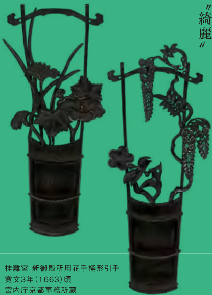
桂離宮 新御殿所用花手桶形引手 寛文3年(1663)頃 宮内庁京都事務所蔵