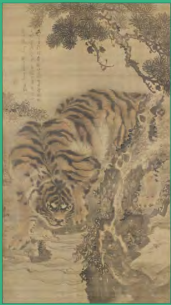
竄下猛虎図 岸駒筆 文化8年(1811) 朝日町立ふるさと美術館蔵