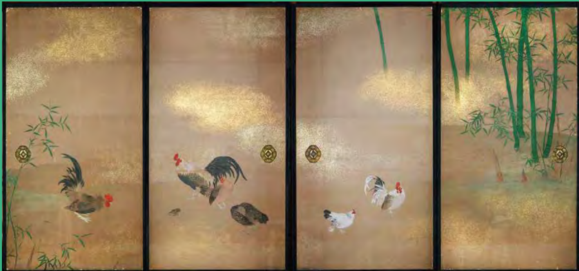
大聖寺門跡 宮御殿障壁画 竹鶴図 望月玉川筆 文政8年(1825) 大聖寺門跡蔵〔前期展示(後期は裏面「波に鶴図」に展示替)〕