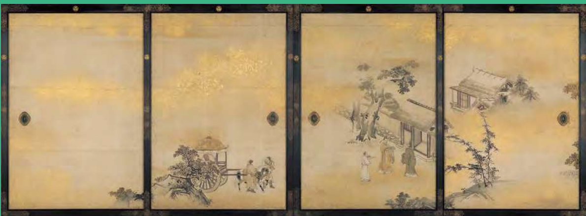
【重要文化財】名古屋城本丸御殿 上洛殿一之間障壁画 帝鑑図〔蒲輪微賢〕狩野探幽筆 寛永11年(1634) 名古屋城総合事務所蔵