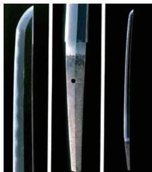
刀 初代兼若 江戸時代 本館蔵

加賀の地で作刀された加州刀を、古刀から新刀・新々刀まで、系譜別・年代別に俯瞰し、魅力を探ります。なかでも「兼若」や「清光」の代々は庄巻です。併せて当館所蔵の甲冑や袴の逸品も公開します。