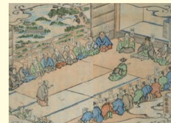
夷曲百人一首 本館蔵

文芸資料と工芸品のコラボレーションをテーマに、これまで収集してきた資料を、「百万石文化」というステージの上で、わかりやすく紹介します。