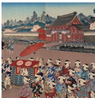
「松乃栄」(部分) 東京大学総合図書館蔵

前田家が江戸に構えた本郷邸は、藩主一族や藩士の暮らしの場であると同時に、将軍が大名の屋敷を訪れる御成や、藩主の婚礼の場にもなりました。前田家に伝わった美術品や本郷邸跡の発掘調査の成果からその実像に迫ります。