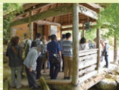
初夏の歴史散歩の様子

※れきはくメイト会員は随時募集しています。詳しくは当館普及課までお問合せください。