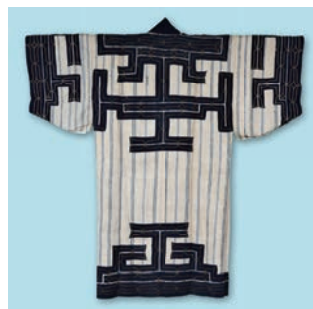
輪島市に伝わるアイヌの衣装(19世紀)

海は、アイヌにとって生業の場であるだけでなく、外の世界とつながる交易の道でもありました。北前船による蝦夷地(北海道)と本州の産物往来にも、アイヌが深く関わっています。海に関わるアイヌの工芸品と、北陸に伝わる関係資料を紹介します。