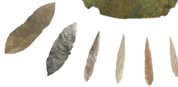
本ノ木遺跡 石槍 (津南町教育委員会蔵)