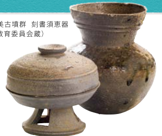
史跡 能美古墳群 刻書須恵器 (能美市教育委員会蔵)