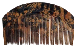
金沢城下町遺跡 籠甲製櫛 (石川県埋蔵文化財センター蔵)