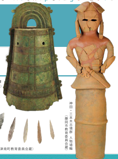
神田・三本木古墳群 人物埴輪 (藤岡市教育委員会蔵)

日本各地で毎年約8000件の遺跡の発掘調査が行われています。この展覧会では、近年発掘された遺跡や調査成果のまとまった注目の遺跡を速報で展示します。さらに、特集展示として、墓室に文様や彩色が施された装飾古墳の魅力とその保護の取り組みも紹介します。