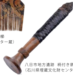
八日市地方遺跡 柄付き鉄製籠 (石川県埋蔵文化財センター蔵)