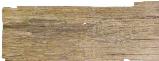
史跡 加茂遺跡 加賀郡勝示札 (重要文化財、石川県埋蔵文化財センター蔵) ※展示は9月2日まで