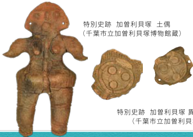
特別史跡 加曾利貝塚 土偶 (千葉市立加曾利貝塚博物館蔵)