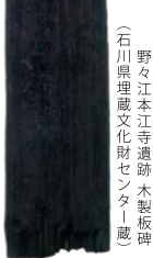
(石川県埋蔵文化財センター蔵) 野々江本江寺遺跡 木製板碑