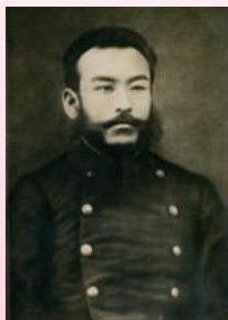
島田一郎肖像(本館蔵)