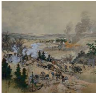
西南役熊本籠城図幅(個人蔵)