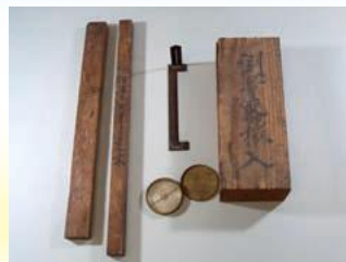
地租改正で用いた測量具(福井県立歴史博物館蔵)