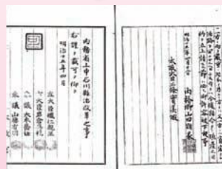
石川県治改革ノ件(公文別録、国立公文書館蔵)

展示構成 序章 幕末の加賀藩 第2章 石川県の誕生 第4章 士族の反乱 第1章 戊辰戦争から廃藩へ 第3章 地租改正と民衆 終章 幕末・維新期の記憶