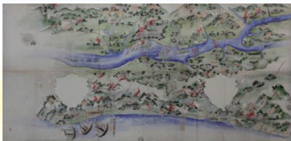
北越戦争絵図(石川県指定文化財、前田土佐守家資料館蔵)

本展覧会では、幕末の動乱から戊辰戦争、維新の諸変革への対応、士族の民権運動や西南戦争・紀尾井町事件(大久保利通暗殺事件)などの士族反乱、さらに明治16年(1883)に現在の石川県域が確定する過程をたどり、明治前期の政治・社会を地域の視点から紹介します。