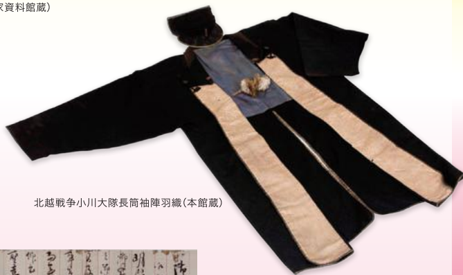
北越戦争小川大隊長高袖陣羽織(本館蔵)