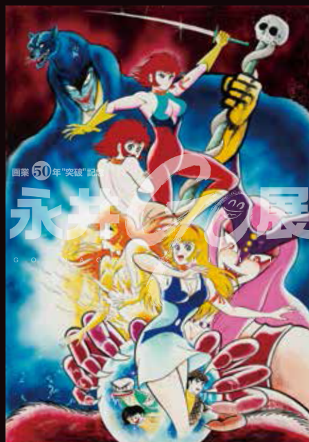
「キューティーハニー」

© 1967-2019 Go Nagai / Dynamic Production