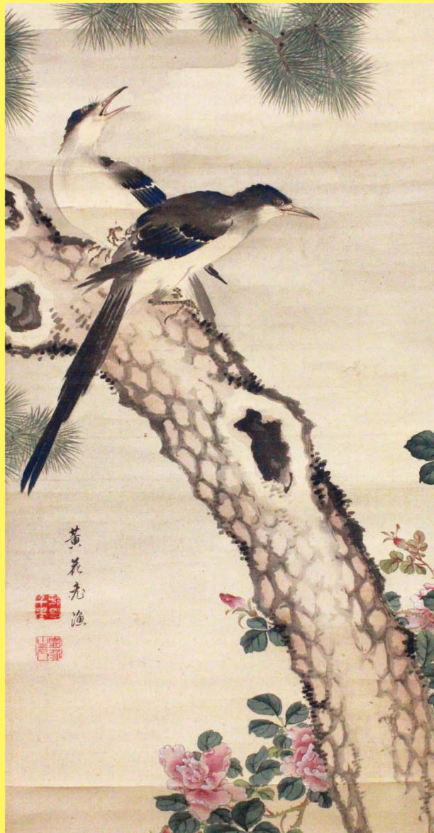
高木雙喜図(部分) 村田翠丈(千里)筆 江戸時代 18~19世紀