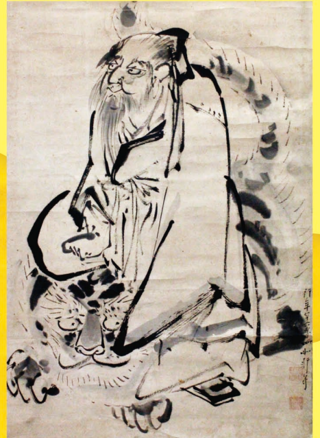
豊干禅師図 矢田四如軒筆 江戸時代 18世紀

本展では、村松コレクションの郷土資料の中から「絵画」を中心に、併せて「書」を公開し、さらに個人所蔵で携帯筆記用具としての「矢立」の逸品も特別に展示いたします。